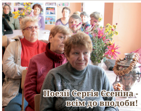
Поезії Сергія Єсеніна - всім до вподоби!

Клуб «Криниця життя» став тим приємним куточком, де жінки можуть поділитися своїми проблемами, обговорити різні життєві ситуації, усвідомити щось нове та цікаве, відпочити душею. Створити позитив і гарний настрій, показати приклад, захопити жінок творчим заняттям - це головна мета клубу «Криниця життя».