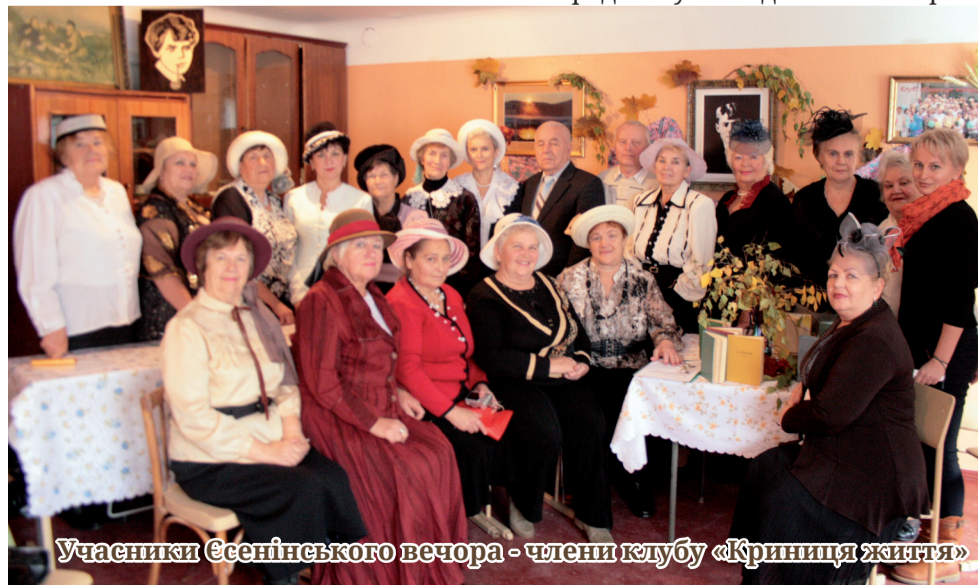
Учасниці Єсеніньського вечора - члени клубу «Криниця життя»

Більшість пенсіонерів вважає клуб своєю другою домівкою, тим місцем, куди прагнуть приходити знову й знову.